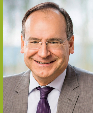
Oliver Quilling, Landrat des Kreises Offenbach